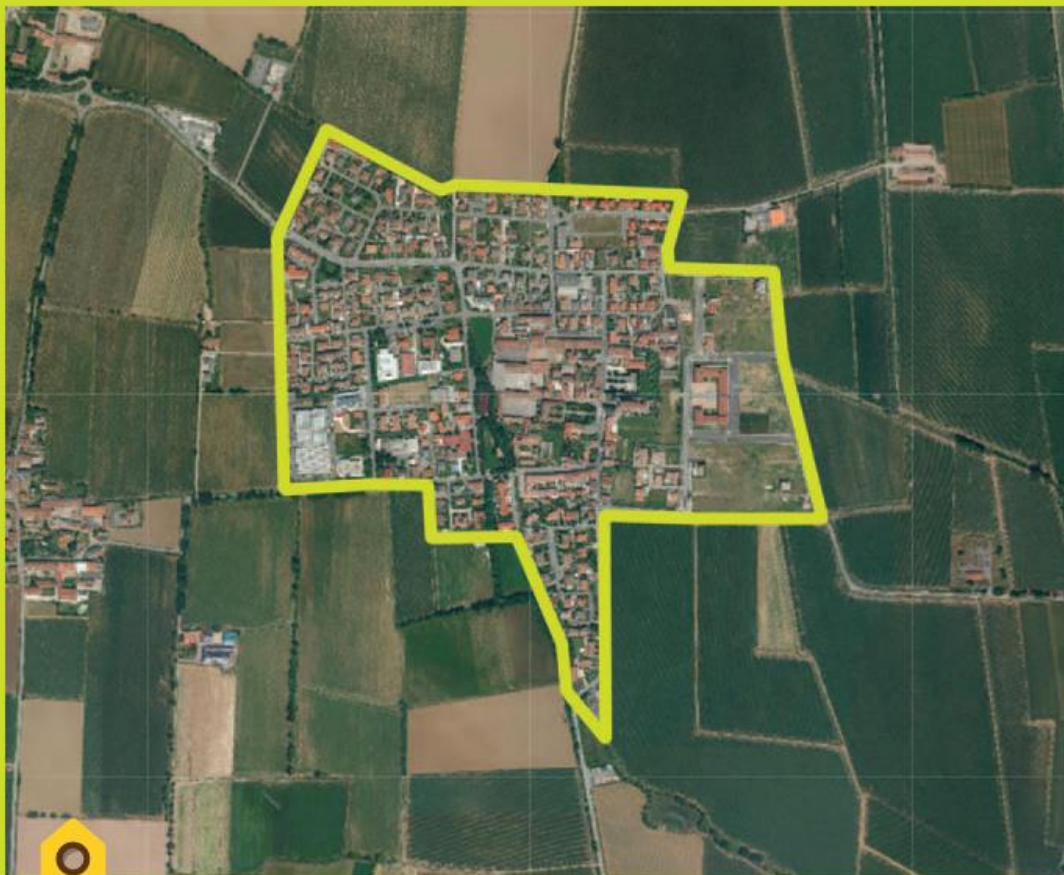
Area del Comune di Brandico interessata al censimento