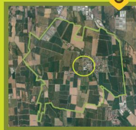
Territorio del Comune di Brandico